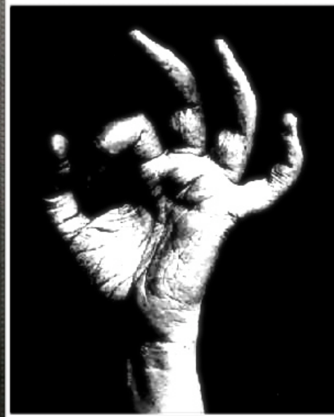
Mà de Marie Jaëll Exercicis fora del teclat

Aquesta manera de treball implica una reducció d'hores de treball. El mètode Jaëll compara el pianista amb el cantant. El cos ha d'estar realitzant una sèrie de funcions fisiològiques que necessiten d'un repòs per a després reempendre el treball amb més energia.